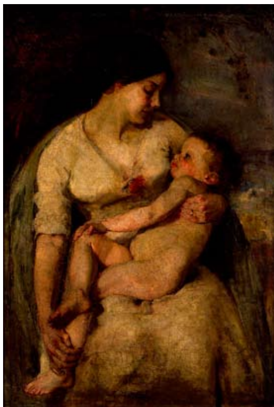
Grace Joel: Mother and Child (c. 1910)