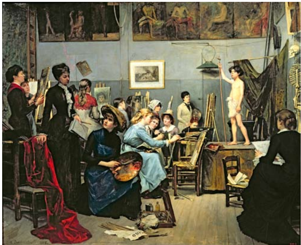
Marie Bashkirtseff: Académie Julian, Paris (1881)