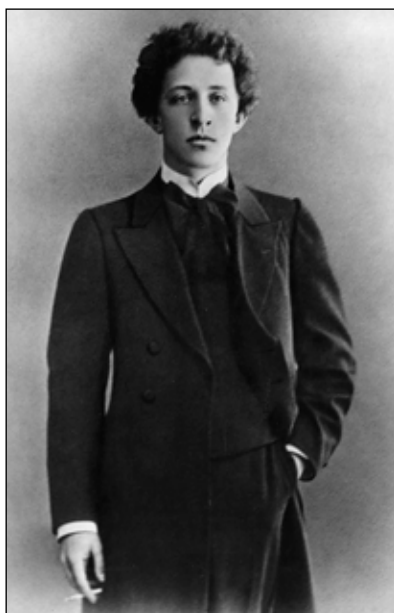
Aleksandr Blok 1907

Snart blev de båda personligen bekanta efter att först ha inlett en intensiv brevväxling. Redan vid tiden för Bloks debut 1904 med Dikter om den undersköna damen (en ironisk konklusion av det högstämnda budskapet) hade Belyj klart för sig att den utvalde hade börjat svikta, att han höll på att ge efter för resignation och inre mörker. Bloks unga hustru Ljubov hade från begynnelsen varit det konkreta jordiska föremålet för hans kultpoesi. I detta läge började Belyj rivalisera med Blok både på det äktenskapliga planet och det teurgiska, ett triangeldrama kom till stånd med den första ryska revolutionen 1905 som fond. Den mystiska upphetsningen hade vid det laget lagt sig hos båda två: så kom sekelskiftesförhoppningarna att knytas till upproret mot ett stagnerat tsarsamhälle. Solovjovs idéer flätades ihop med socialismens och anarkismens.