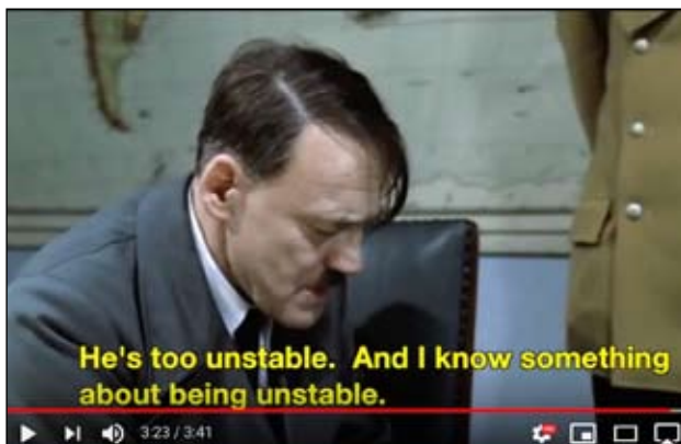
Hitler (Bruno Ganz) kommenterar Trump. Youtubeklipp från 2016 med fejkade undertexter.

Finland har visserligen också utbildat 4500 kurdiska peshmerga-soldater ( Helsingin Sanomat 11.10), som nu ironiskt nog attackeras av Turkiet med bland annat finländska vapen. Att ta hem en handfull barn till IS-krigare från flyktingläger i Syrien var däremot övermäktigt för vårt land. Borde de ha bokats via Thomas Cook?