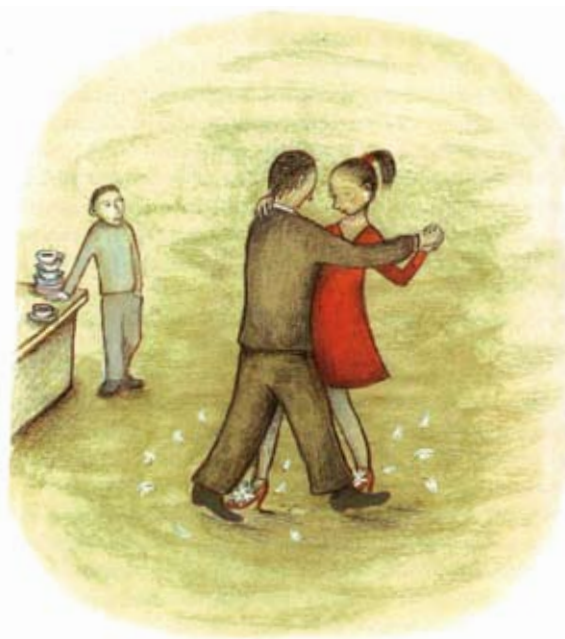
Bill tog henne om livet och log med alla de jämna, vita tänderna. Sedan dansade de, och flickan haltade inte mer. Det var precis som i en saga.

tomtar och troll -bidrag med bilderna till ”Dagen när jag var Gregor”.