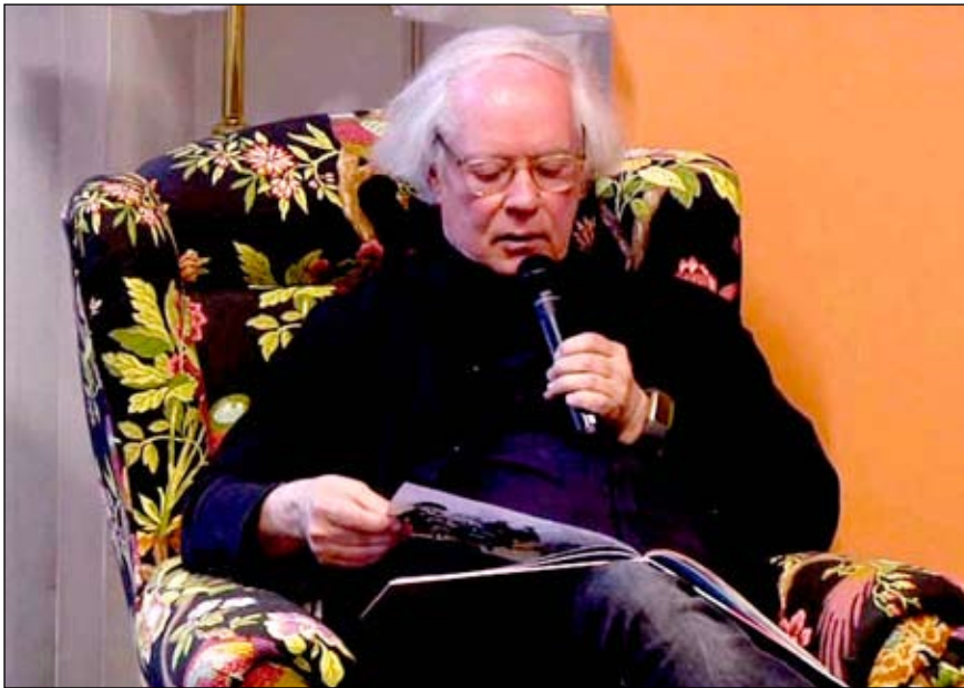
Ulf Stark läser sagor 2016 på Svenska barnboksinstitutet.

möbler. ”Ulf Stark hittade också på att verkliga personer gjorde saker som de aldrig gjort på riktigt”. När man blandar ”riktiga minnen med påhittade sådana” är det lätt att förvanska. Och Ulf tror att alla egentligen ”hittar på sina barndomar”.