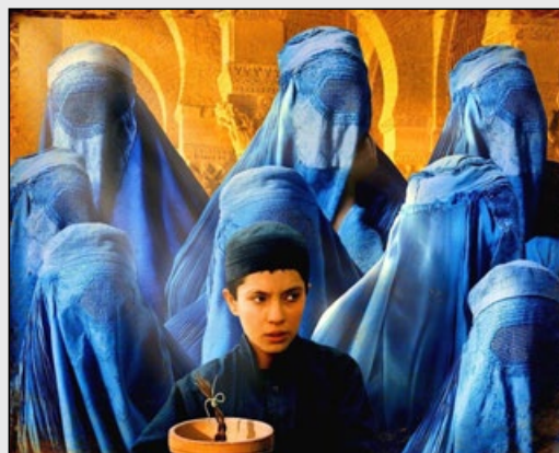
Ur Osama (2003)