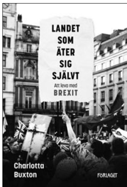
Omslag av Christina Lax.

Psykologiserandet av det forna imperiet blir mot slutet en smula excessivt, men Buxton tar sig an det kluvna landet med fin känsla för stämningar och platser.