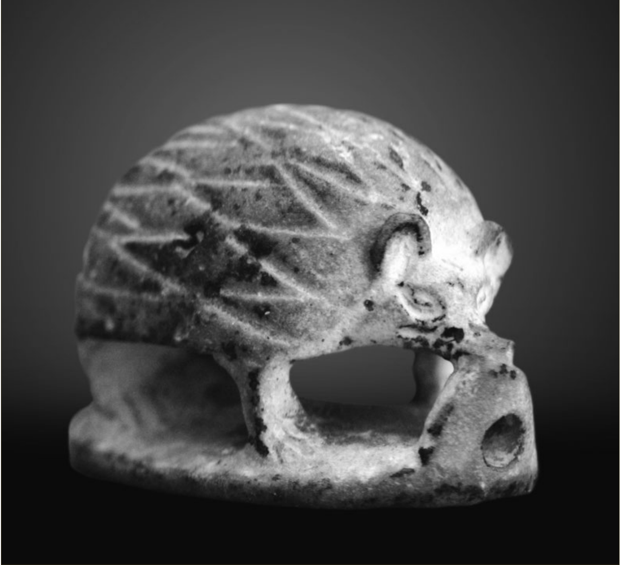
Egyptisk figurin i täljsten och emalj från perioden 1069–664 före vår tideräknings början (Musée d'Art et d'Histoire de Genève/nr A 2004-0072).

dem åter isär. Det avstånd de slutligen finner, på vilket samexistens är möjlig, är artigheten och konvensansen. Till dem som inte håller detta avstånd, ropar man i England: keep your distance! – Därigenom blir behovet av ömsesidig värme endast ofullständigt tillfredsställt, men man undgår att bli stungen av taggarna. – Men de, som har egen värme i rikt mått, föredrar att hålla sig borta från gemenskapen för att undgå givandet och tagandet av klagomål. 3