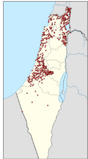
Hundratals byar och städer i Palestina ”rensades” på sin arabiska befolkning under striderna 1947–48. På ett 50-tal orter genomförde judiska styrkor massaker på civila. De cirka 700 000 palestinska flyktingarna förbjöds att återvända och 1965 förstörde Israel över 100 av det som fanns kvar av de arabiska byarna. En interaktiv karta med detaljer om varje ort finns på en.wikipedia.org/wiki/Nakba . Mellan 1948 och 1951 flyttade eller flydde omkring 260 000 judar från arabländer till Israel.

under de tidigare stora hämndbombningarna av Gaza 2008–09 (3 döda civila israeler) och 2014 (5), som tillsammans krävde cirka tvåtusen civila palestiniers liv.