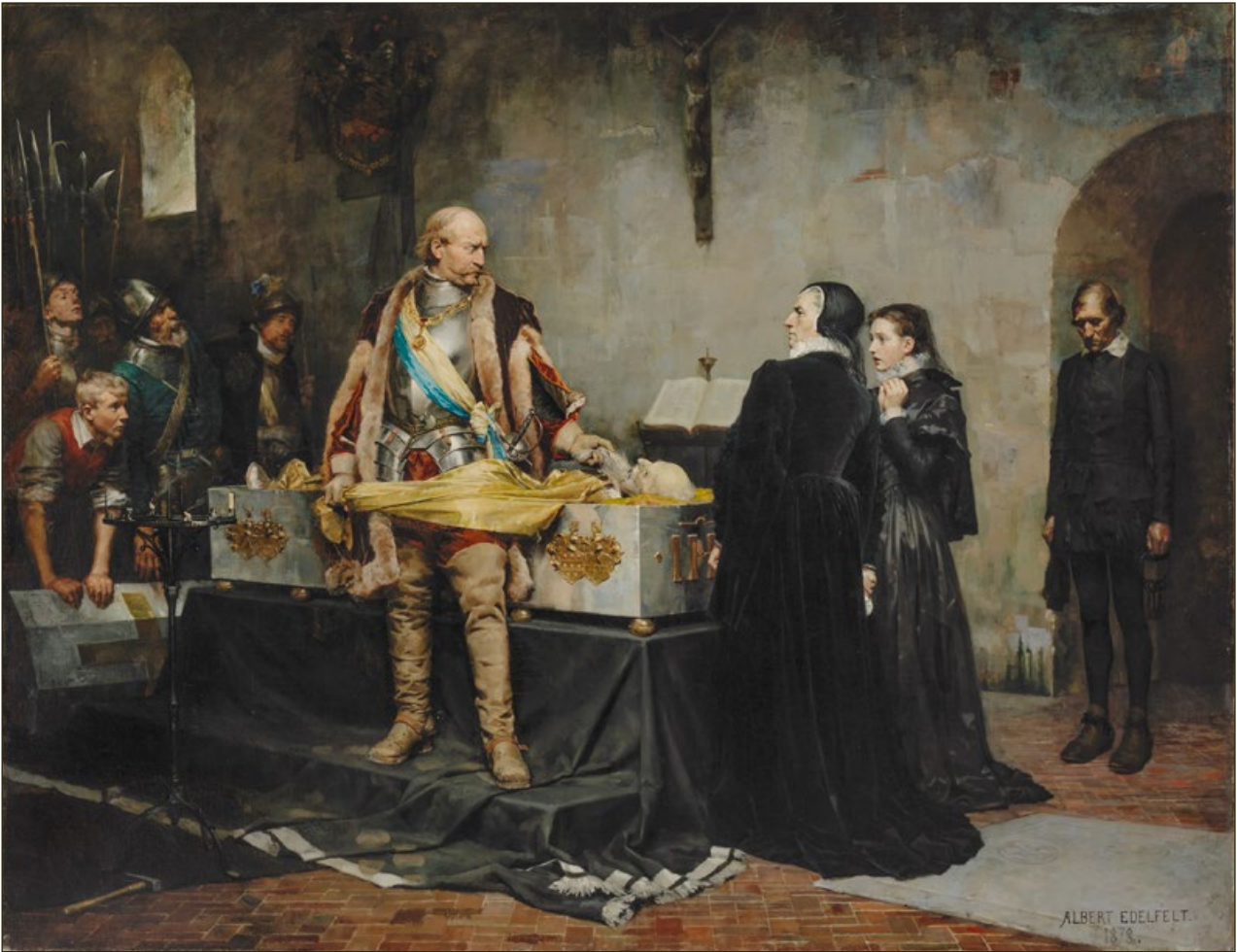
Hertig Karl, skymfande Klas Flemings lik, målning av Albert Edelfelt (157 × 202 cm, olja på duk, 1878). Scenen är Åbo slott år 1597. Flemings änka Ebba Stenbock är måttligt trakterad av hertigens närvaro.