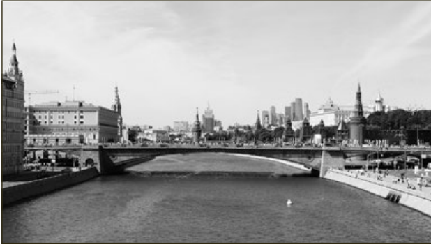
Bolsjoj Moskvoreskij-bridgen, maj 2018.

fentligheten skulle Putins auktoritet ha kunnat försvagas kraftigt.