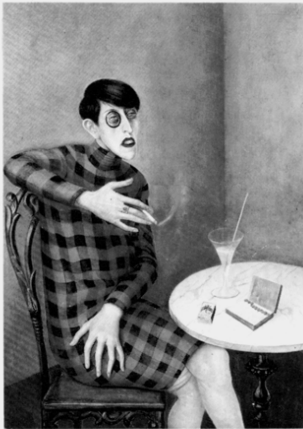
Otto Dix, Journalisten Sylvia von Harden . 1926.